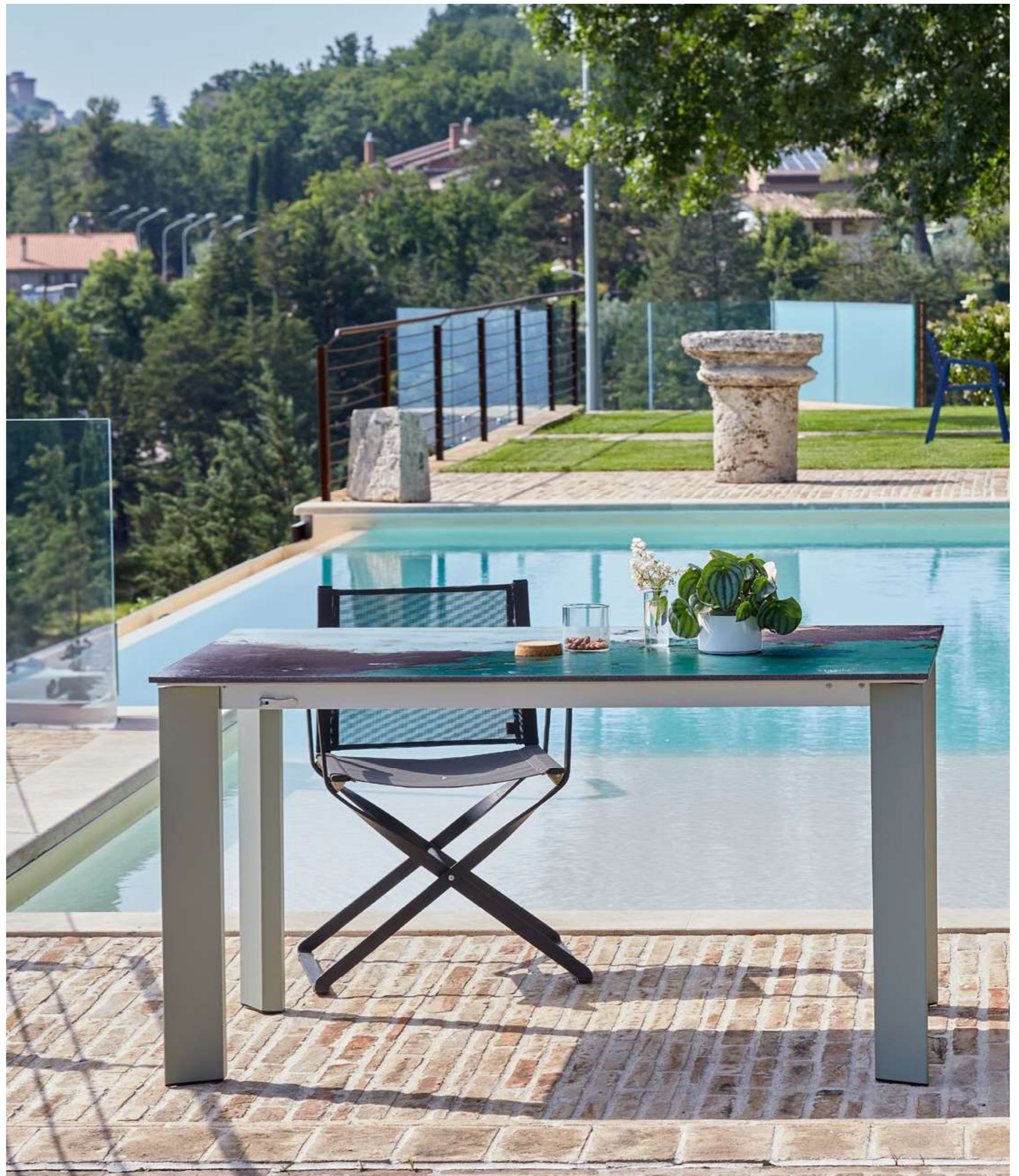
DESIGN ANDE COD 214