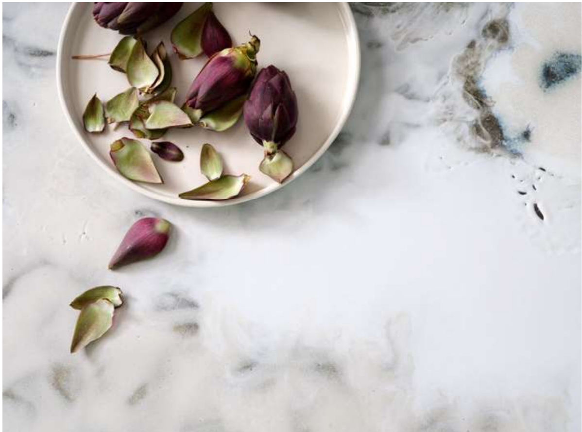
ROCCIA BIANCO COD 195