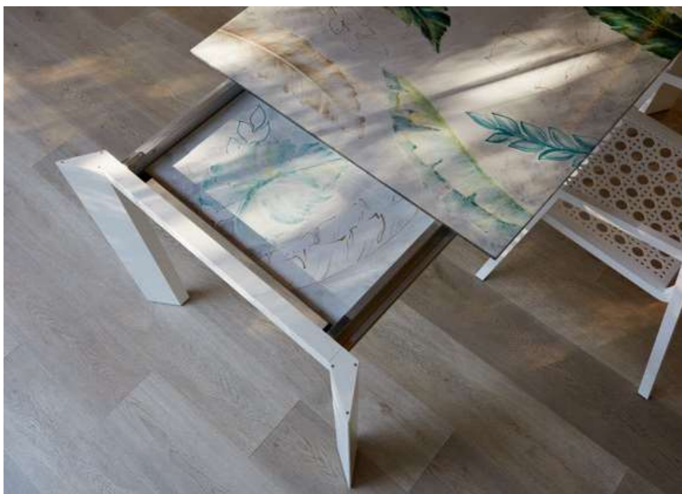
TABLE CRIS ALUMINIUM WHITE 142 / 202x92 cm DESIGN DAFNE COD 196 ARMCHAIR VIENNA ALUMINIUM WHITE