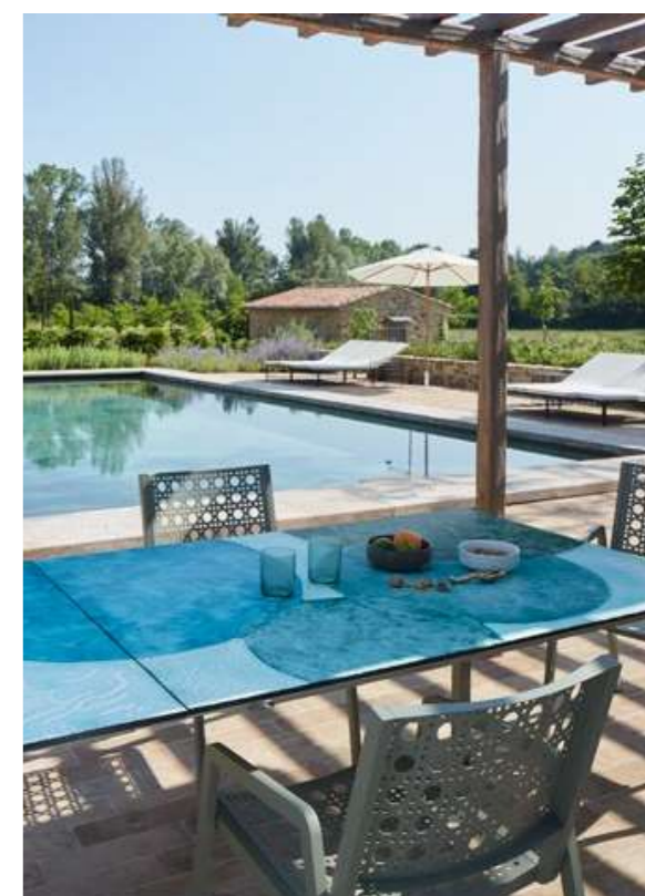
TABLE CRIS ALUMINIUM GREEN 142 / 202x92 cm