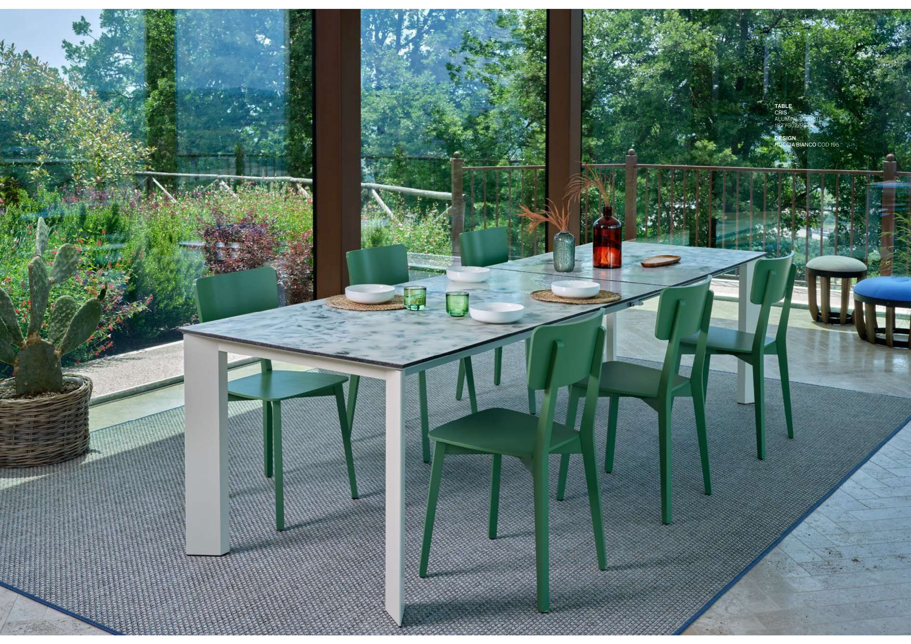
TABLE CRIS ALUMINIUM WHITE 182 / 302x92 cm DESIGN ROCCIA BIANCO COD 195