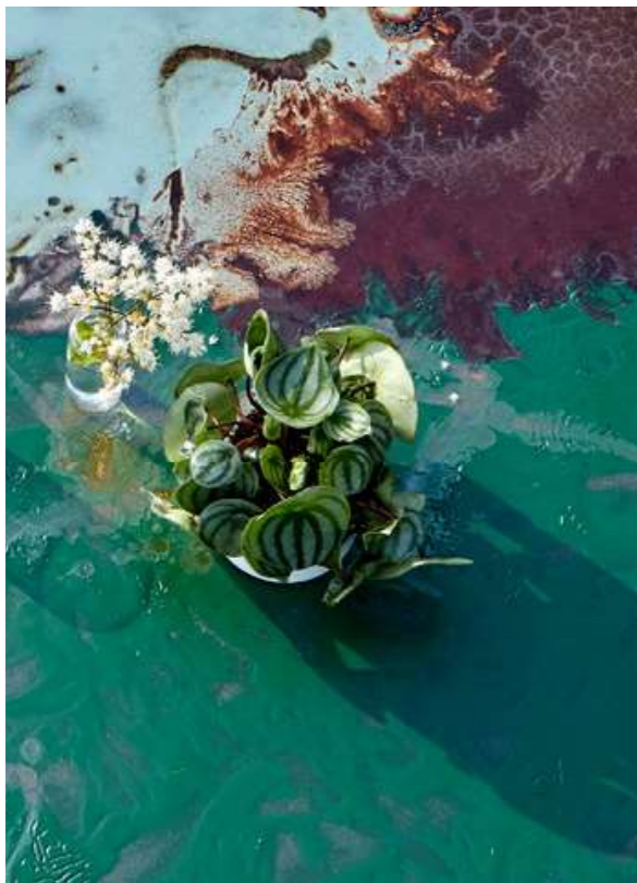
TABLE CRIS ALUMINIUM GREEN 142 / 202x92 cm