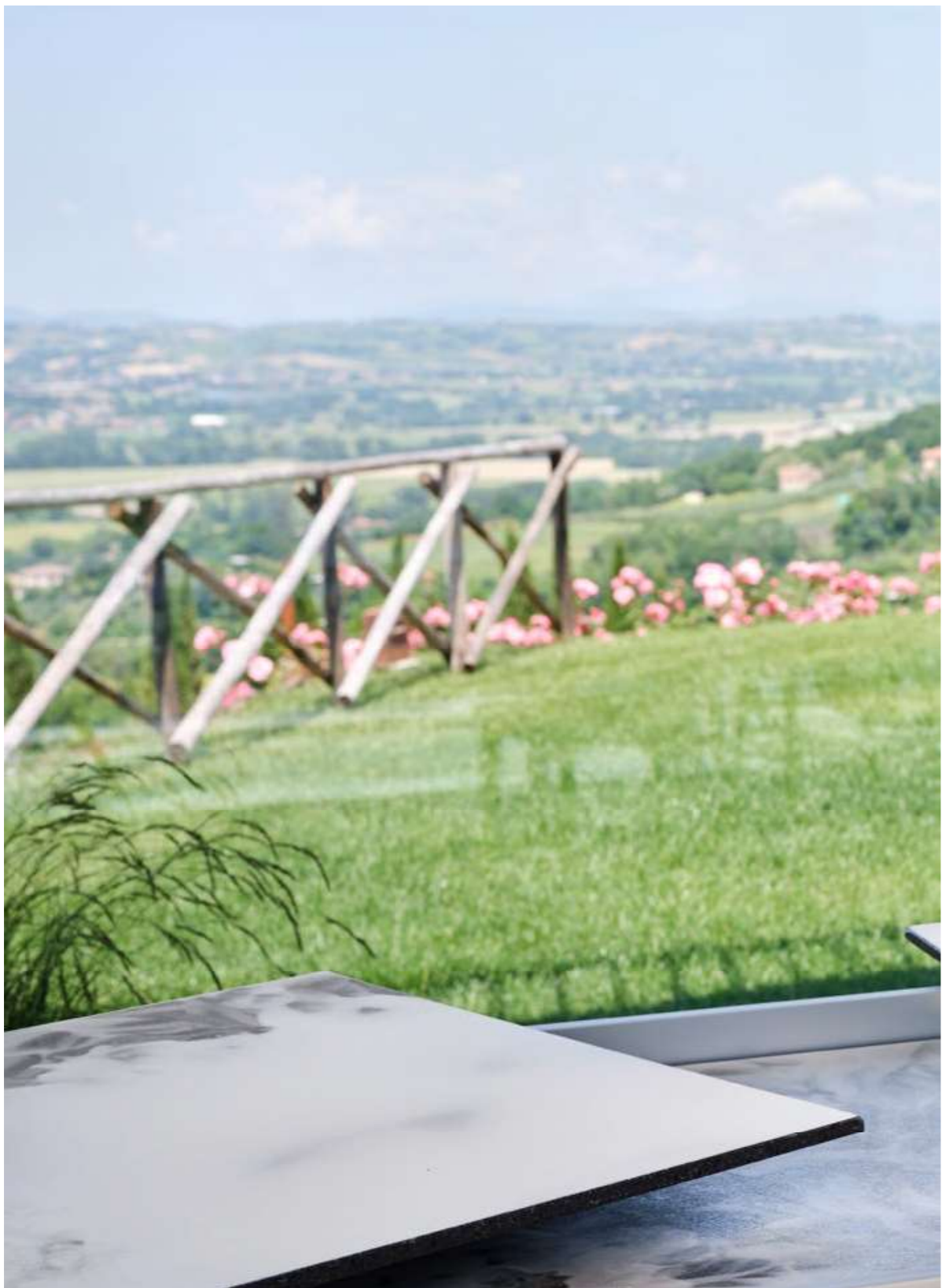
ROCCIA BIANCO COD 195