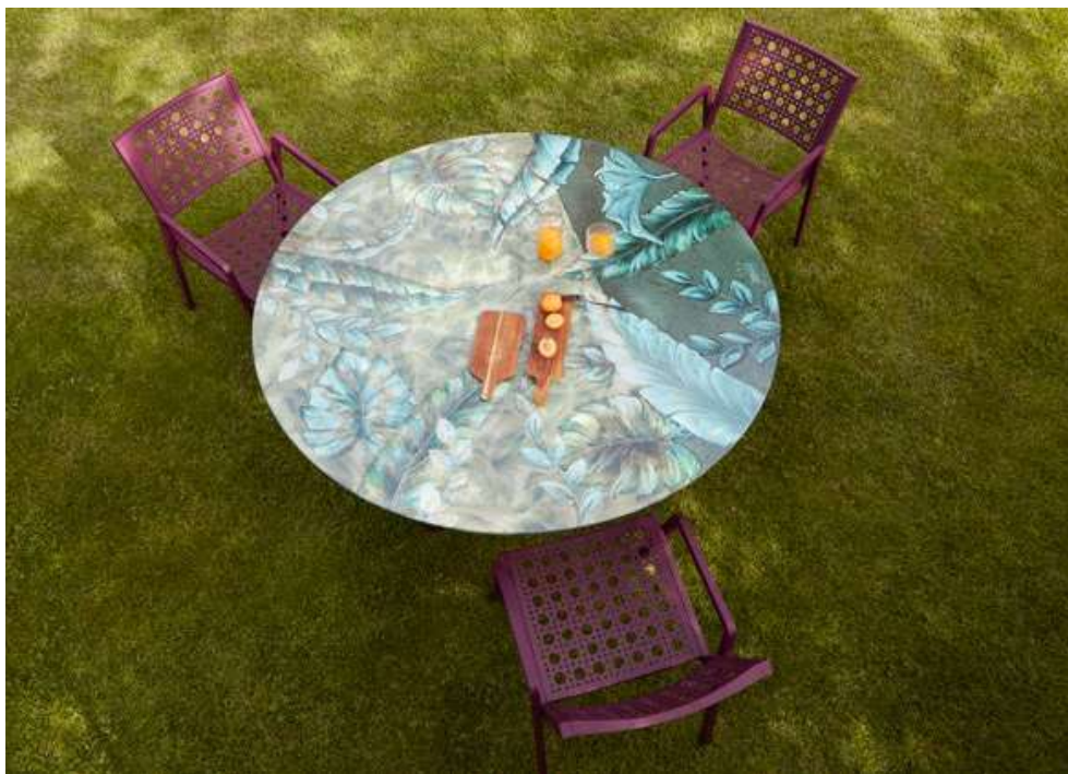
TABLE COLONNE INOX PURPLE Ø 150 cm