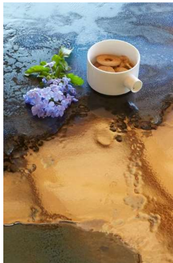
TABLE COLONNE WALNUT-PAINTED SOLID OAK Ø 130 cm DESIGN BAJKAL COD 199