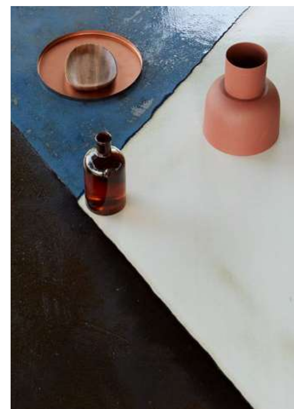
TABLE COLONNE INOX PURPLE 180x90 cm