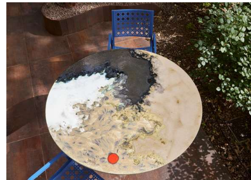
TABLE COLONNE INOX BLUE Ø 120 cm DESIGN ROCCIA COD 167 ARMCHAIR VIENNA ALUMINIUM BLUE