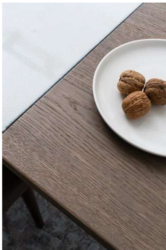
TABLE ATLANTE NATURAL SOLID OAK 260x105 cm DESIGN BRINA COD 58